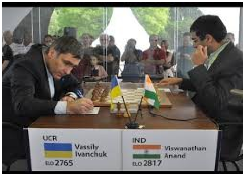
Anand en Ivantsjoek aan het begin van hun partij in 1994

Ivantsjoek kan mat in één geven met 29...De4xh1. Maar het ongelooflijke gebeurt: Ivantsjoek ziet de matzet totaal over het hoofd en speelt 29...De4-f4+. Na 30.Pe5-f3 weet Anand de mataanval af te slaan en wint hij later de partij. Een zeldzame blunder van een topgrootmeester!